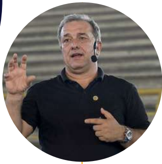
Cesar Arturo Álzate Alcaldía de La Dorada