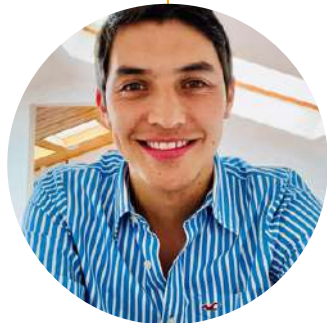
Julián Moreno Barón Alcalde Local de Suba