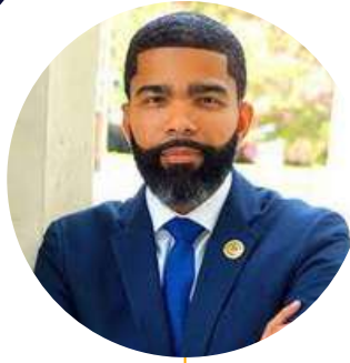
Chowke Antar Lumumba Alcalde de Jackson, Misisipi