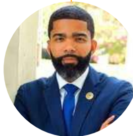
Chowke Antar Lumumba Alcalde de Jackson, Misisipi