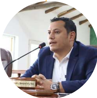
Luis Carlos Segura Alcalde de Chía