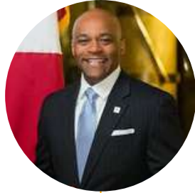
Michael Hancock Alcalde de Denver, Colorado