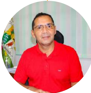
Eduardo Cortés Trujillo Alcalde de Acacías