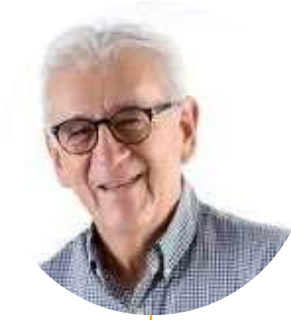
Jairo Tomás Yañez Rodríguez Alcalde de Cúcuta