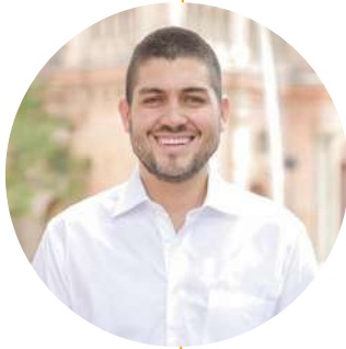
Óscar Escobar García Alcalde de Palmira